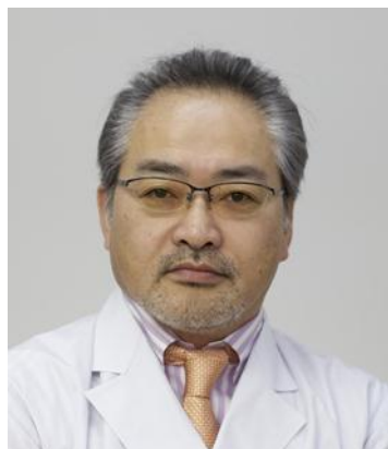
川崎幸病院 副院長 脳血管センター長 脳血管内治療科部長