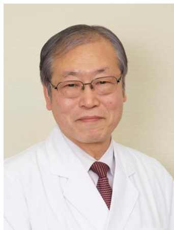
川崎幸病院 副院長 呼吸器外科部長