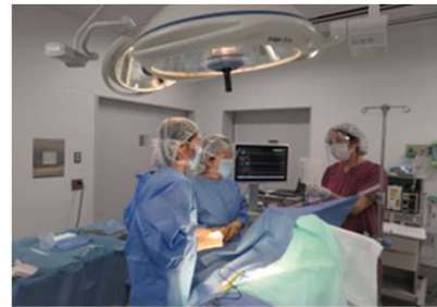
第二川崎幸クリニックでの日帰り手術

乳がん手術は乳房部分切除術、乳房切除術、センチネルリンパ節生検、腋窩廓清を入院施設のある川崎幸病院で行いますが、乳腺良性腫瘍摘出術、吸引式組織生検術、乳腺悪性腫瘍手術(部分切除術)は第二川崎幸クリニック内で日帰りで行うことができます。術後の経過観察、薬物療法も引き続き第二川崎幸クリニックで、また術後の放射線治療は川崎幸病院にて通院で行えます。術前・術後化学療法、分子標的治療、ホルモン療法は基本的には外来で行いますが、入院を要する際には川崎幸病院で行います。また緩和医療が必要な場合には協力施設と連携しながら進めて参ります。