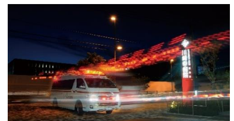
救急隊との24時間ホットライン対応

川崎奇形病院では脳神経外科医が365日24時間体制で常駐し、可能な限り脳卒中の患者さんを受け入れる方針をとっております。また救急隊とはホットライン(直通電話)で応答しておりますので、迅速な対応が可能です。