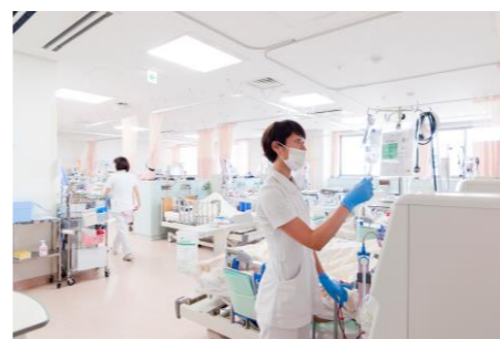
川崎幸病院 入院透析室

川崎幸病院では、入院透析15床/外来透析35床にて血液透析治療を行っています。外来透析では超純粋(ultra pure)な透析液を使用して全日本で最新の血液浄化療法(on line HDFなど)が可能です。さらに、当法人内外来透析施設である川崎クリニック・さいわい鹿島田クリニックと連携し、治療を行っています。また、腹膜透析(CAPD)については、川崎クリニックにて外来診療を行っております。