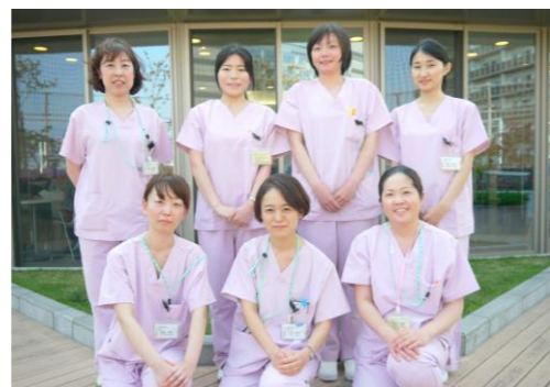
川崎幸病院栄養科スタッフ (管理栄養士)

透析導入前には腎機能増悪を少しでも遅延させるべく低蛋白食を中心とした食事療法を積極的に指導しております。また透析導入後も透析療法に応じた食事指導をさせていただきます。