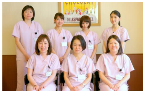
川崎幸病院 栄養科スタッフ (管理栄養士)

透析導入前には腎機能増悪を少しでも遅延させるべく低蛋白食を中心とした食事療法を積極的に指導しております。また透析導入後も透析療法に応じた食事指導をさせていただきます。