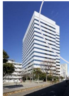
外来透析:113床 CAPD外来/専門外来