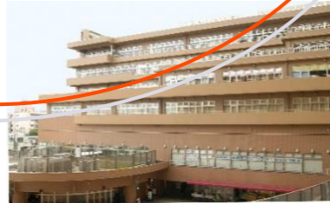
外来透析:104床 専門外来