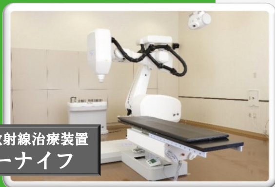
高精度定位放射線治療装置 サイバーナイフ