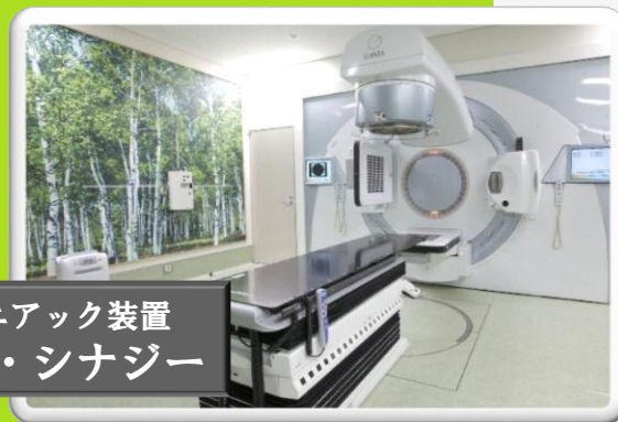
最新鋭リニアック装置 エレクタ・シナジー

8月16日（金）14:00～16:00 川崎クリニック6階会議室 ※先着90名になります