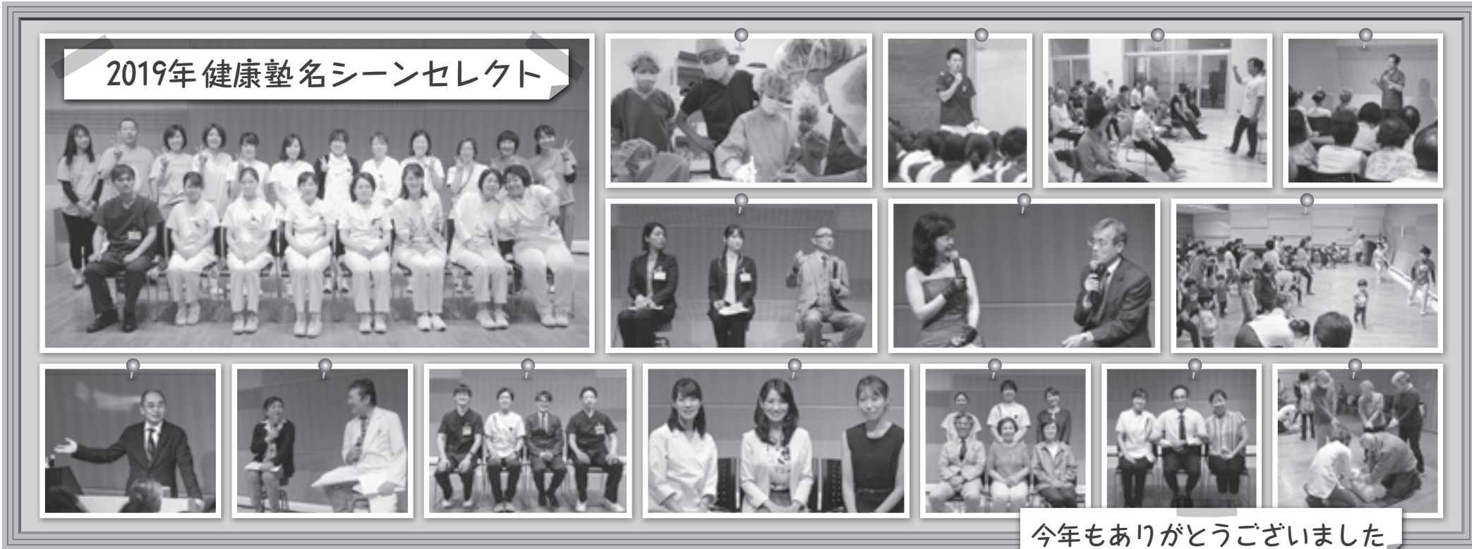
今年もありがとうございました