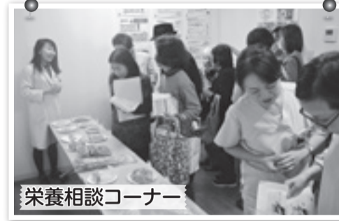
栄養相談コーナー