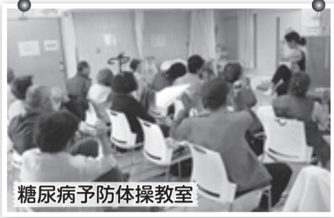
糖尿病予防体操教室