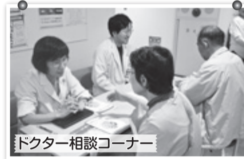
ドクター相談コーナー