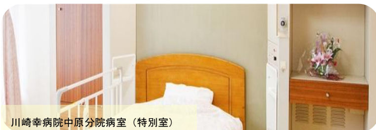
川崎幸病院中原分院病室(特別室)

◇標榜科目：内科／外科／循環器内科／呼吸器内科／脳神経外科／心臓血管外科／消化器内科／消化器外科／泌尿器科／肛門外科／糖尿病・代謝内科