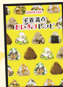
【管理栄養士監修】栄養満点おにぎりレシピ