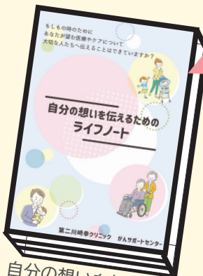
自分の想いを伝えるためのライフノート