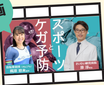
【スポーツドクター×アスリート】スポーツとケガ予防